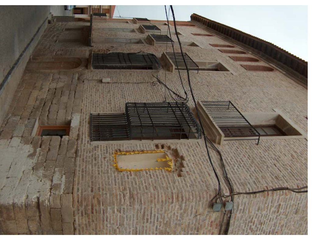
Edificio catalogado: Casa Mora